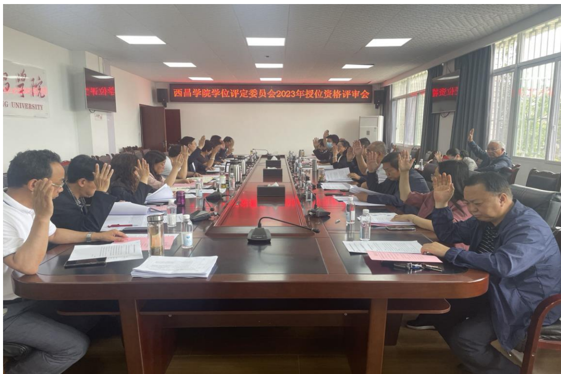
全体参会委员投票表决

全体参会委员对申请授位学生的授位资格进行审议，投票表决通过 2023 年第一批授予学士学位名单。